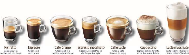
Ristretto Espresso scurt cu cantitate mai mica de apa