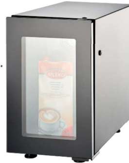
FRIGIDER LAPTE 4 lt.