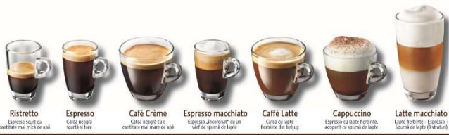
Ristretto Espresso scurt cu cantitate mai mica de apa Espresso Cafea maciata scurta si tare Café Crème Cafea tare si cu cantitate mai mare de apa Espresso macchiato Espresso, cacao/ceai cu un sfert de spuma de lapte Caffè Latte Cafea cu lapte fierbinte din bejag Cappuccino Espresso cu lapte fierbinte, acoperit cu spuma de lapte Latte macchiato Lapte fierbinte + espresso + spuma de lapte (3 straturi)