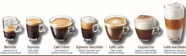
Ristretto Espresso scurt cu cantitate mai mica de apa Espresso Cafea tare si scurta si tare Café Crème Cafea tare cu o cantitate mai mare de apa Espresso macchiato Espresso „zincornat” cu un varf de spuma de lapte Caffè Latte Cafea cu lapte fierbinte din bebelug Cappuccino Espresso cu lapte fierbinte, acoperit cu spuma de lapte Latte macchiato Lapte fierbinte + Espresso + Spuma de lapte (3 straturi)