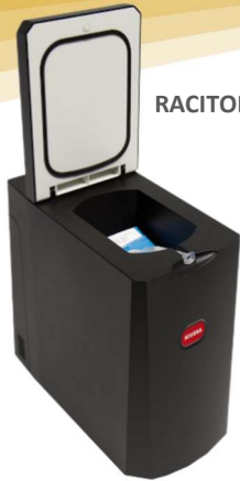
RACITOR LAPTE 1lt.