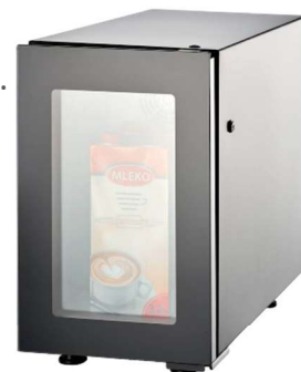
FRIGIDER LAPTE 4 lt.